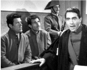
1963 LE JOUR LE PLUS COURT (Il giorno più corto) de S. Corbucci avec Franco & Ciccio