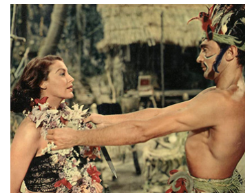
1957 LA PETITE HUTTE (The little Hut) de Mark Robson avec Ava Gardner