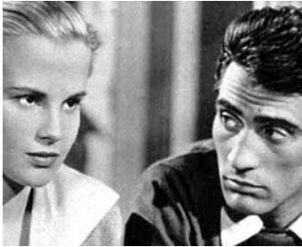
1950 NOUS AVONS VAINCU (Abbiamo vinto !) de Robert A. Stemmle avec Antonella Lualdi