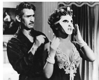
1965 MOI, MOI, MOI ET LES AUTRES (Io, io, io e gli altri) d'A. Blasetti avec Gina Lollobrigida