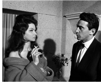
1961 LA FILLE SOUS LE DRAP (La Ragazza sotto il lenzuolo) de Marino Girolami avec Chelo Alonso