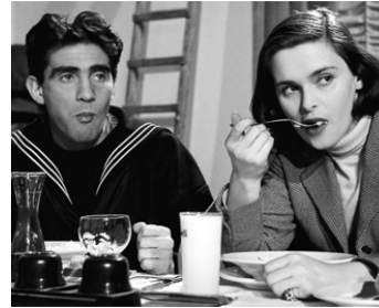
1951 È L'AMORE CHE MI ROVINA de Mario Soldati avec Lucia Bosè