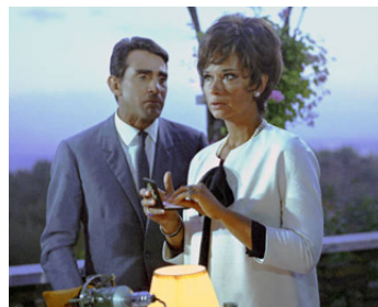
1965 À L'ITALIENNE (Made in Italy) de Nanni Loy avec Lea Massari