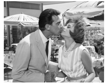
1960 LA CHASSE AUX MARIS (Caccia al marito) de Marino Girolami avec Sandra Mondaini