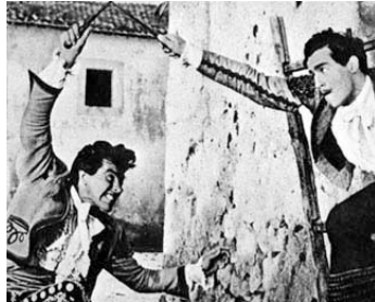
1951 L'HÉRITIER DE ZORRO (Il sogno di Zorro) de Mario Soldati avec Vittorio Gassman