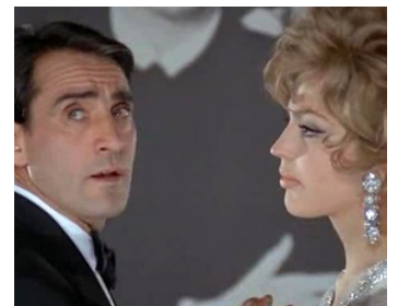
1967 CAPRICE À L'ITALIENNE (Capriccio all'italiana) de Mauro Bolognini avec Ira de Furtenberg