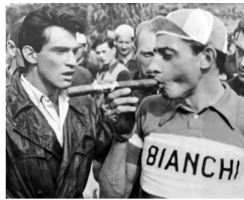
1948 TOTÒ AU TOUR D'ITALIE (Totò al Giro d'Italia) de Mario Mattoli avec Fausto Coppi