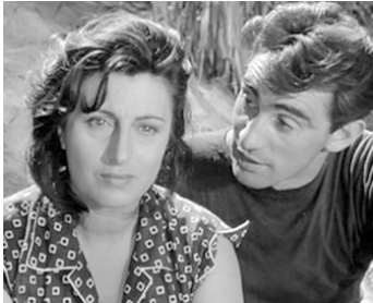
1951 BELLISSIMA (Bellissima) de Luchino Visconti avec Anna Magnani