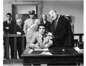
1963 LES DÉPUTÉS (Gli Onorevoli) de Sergio Corbucci avec Mario Scaccia