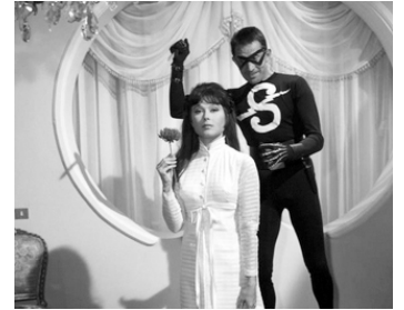
1965 THRILLING (Thrilling, sketch «Sadik») de Gian Luigi Polidoro avec Dorian Gray