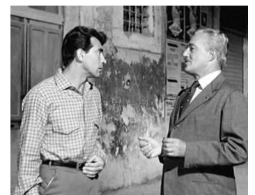
1958 LE FAUX CÉLIBATAIRE (Una mujer para Marcelo) de Giorgio Bianchi avec V. De Sica