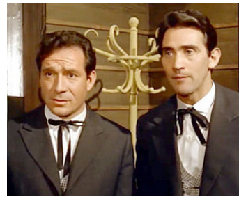
1960 UN DOLLAR DE PEUR (Un dollaro di fifa) de Giorgio Simonelli avec Ugo Tognazzi