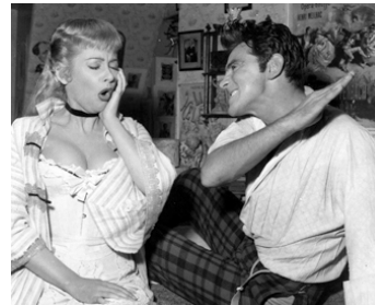
1954 NANA de Christian-Jaque avec Martine Carol