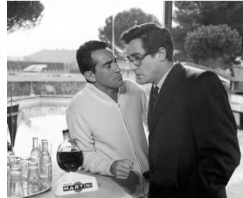
1964 PARLONS FEMMES (Se permette parliamo di donne) d'Ettore Scola avec Vittorio Gassman