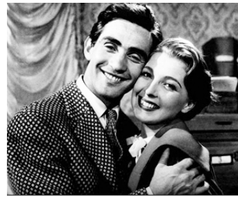
1950 MON FRÈRE A PEUR DES FEMMES (L'inaffabile 12) de M. Mattoli avec Isa Barbizza