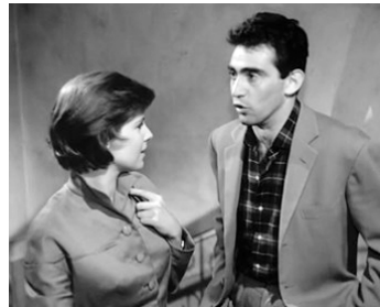
1954 REPRIS DE JUSTICE (Avanzi di galera) de Vittorio Cottafavi avec Antonella Lualdi