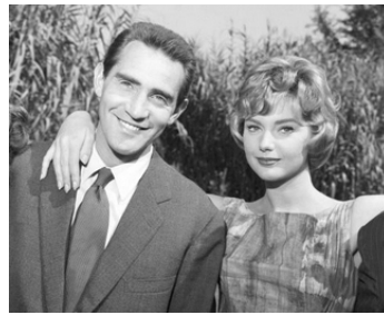
1959 LA SURPRISE DE L'AMOUR (Le Sorprese dell'amore) de L. Comencini avec Sylva Koscina