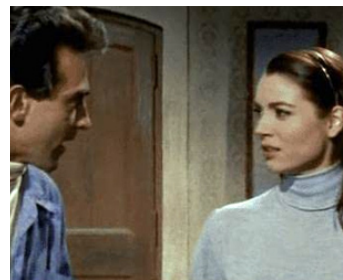
1957 DONATELLA (Donatella) de Mario Monicelli avec Elsa Martinelli