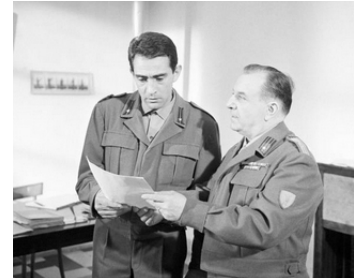
1963 OBIETTIVO RAGAZZE de Mario Mattoli avec Carlo Campanini