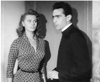
1953 LES GAÏETÉS DE LA CORRECTIONNELLE (Un giorno in pretura) de Steno avec Sophia Loren