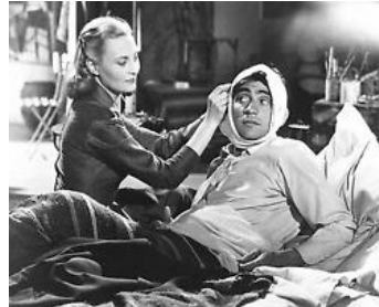
1952 LA MINUTE DE VÉRITÉ de Jean Delannoy avec Michèle Morgan