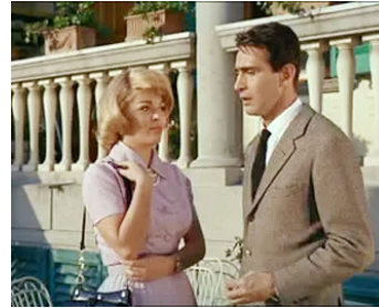
1961 LES BEAUTÉS SUR LA PLAGE (Bellezze sulla spiaggia) de R. Guerrieri avec Valeria Fabrizi