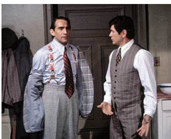
1971 COSA NOSTRA (The Valachi Papers) de Terence Young avec Charles Bronson