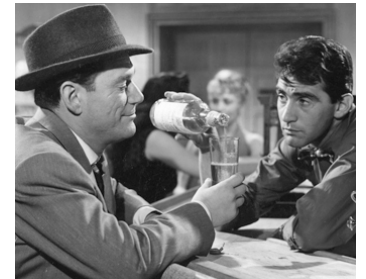
1955 JE SUIS UN SENTIMENTAL de John Berry avec Eddie Constantine