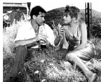
1957 BONJOUR L'AMOUR (Amore a prima vista) de Franco Rossi avec Isabelle Corey