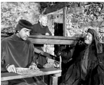
1965 FALSTAFF (Campanadas a medianoche) de et avec Orson Welles