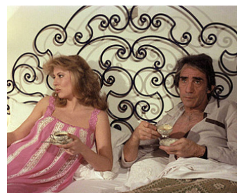
1979 TRE SOTTO IL LENZUOLO de Domenico Paolella avec Daniela Poggi