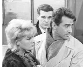
1963 LA FEMME DES AUTRES (La Rimpatriata) de D. Damiani avec J. Pierreux, F. Rabal