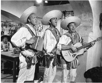
1961 LES TROIS MAGNIFIQUES (I magnifice Tre) de G. Simonelli avec Renato Vianello, Ugo Tognazzi